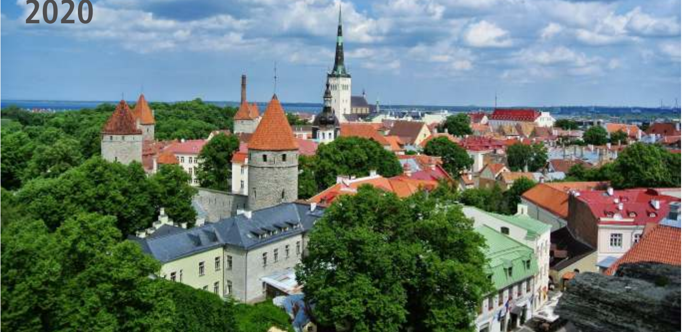
Tallinn, hoofdstad van Estland

In 2020 kunt u met PVGE Best mee met een vlieg/busreis naar de Baltische Staten aan de Oostzee. Litouwen, Letland en Estland zijn landen die eenzelfde geschiedenis, sovjetbezetting en onafhankelijkheid, hebben, maar die onderling veel verschillen. De mengeling van bouwstijlen, sociale verschillen, de mix van geloof en traditie, zorgen ervoor dat deze reis een onvergetelijke beleving zal zijn. Hoogtepunten zijn o. a. de Russisch Orthodoxe Alexander-Nevsky Kathedraal in Tallinn, de Jugendstilarchitectuur in Riga, de Heuvel der Kruisen in Litouwen en zeker ook de Baltische gastvrijheid. Ook zult u genieten van het kleurrijke landschap met afwisselende overgangen en schitterende vergezichten. En u zult ook zeker merken dat deze landen nu al 25 jaar volwaardig lid zijn van de Europese unie.